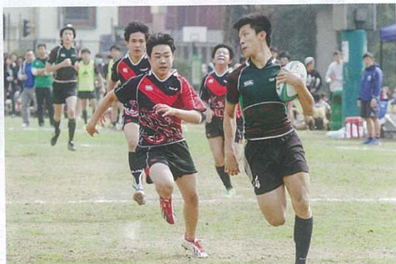
2015年校際七人欖球比賽（甲組）亞軍