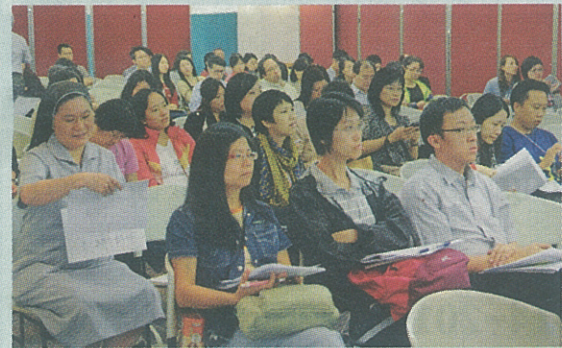
教育工作者出席會議

關神父說，推行心靈教育先由培訓教師入手，讓教師覺察生命是甚麼，從而獲得心靈滋養。「教師親身體會心靈是甚麼，有所得後，再而推動至學生。」